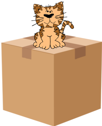
Katten är på lådan.