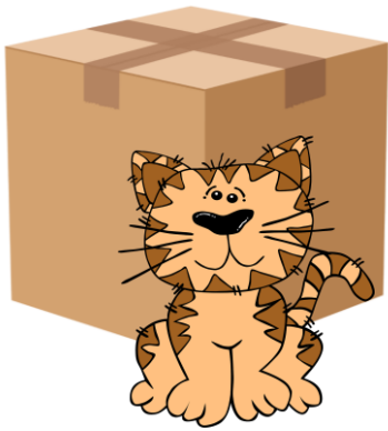
Katten är framför lådan.

Beskriver en persons, saks eller plats position i förhållande till något annat.