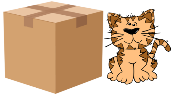
Katten är bredvid lådan.